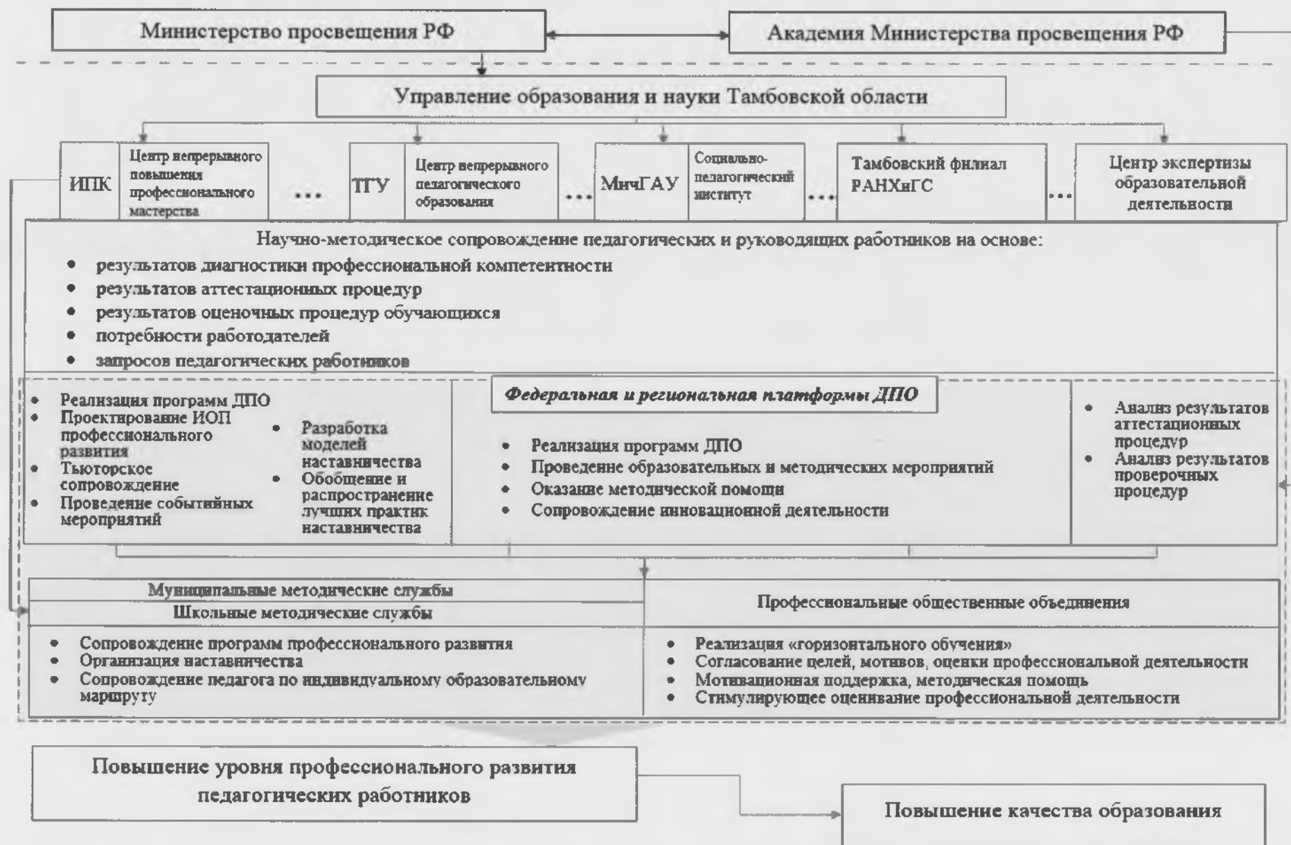
Рис.5. Структура регионального сегмента системы научно-методического сопровождения педагогических работников