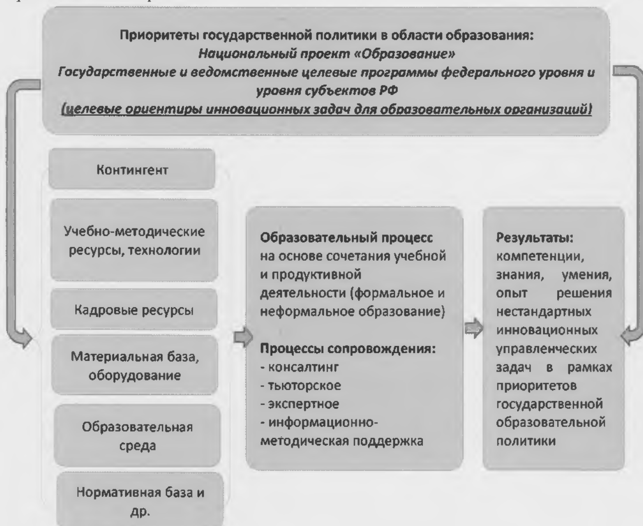
Рис. 3. Модель повышения квалификации «Формирование дополнительных компетенций для нестандартных управленческих задач»

Структура и основное содержание деятельности по повышению квалификации управленческих кадров в рамках данной модели представлены на рис. 3.