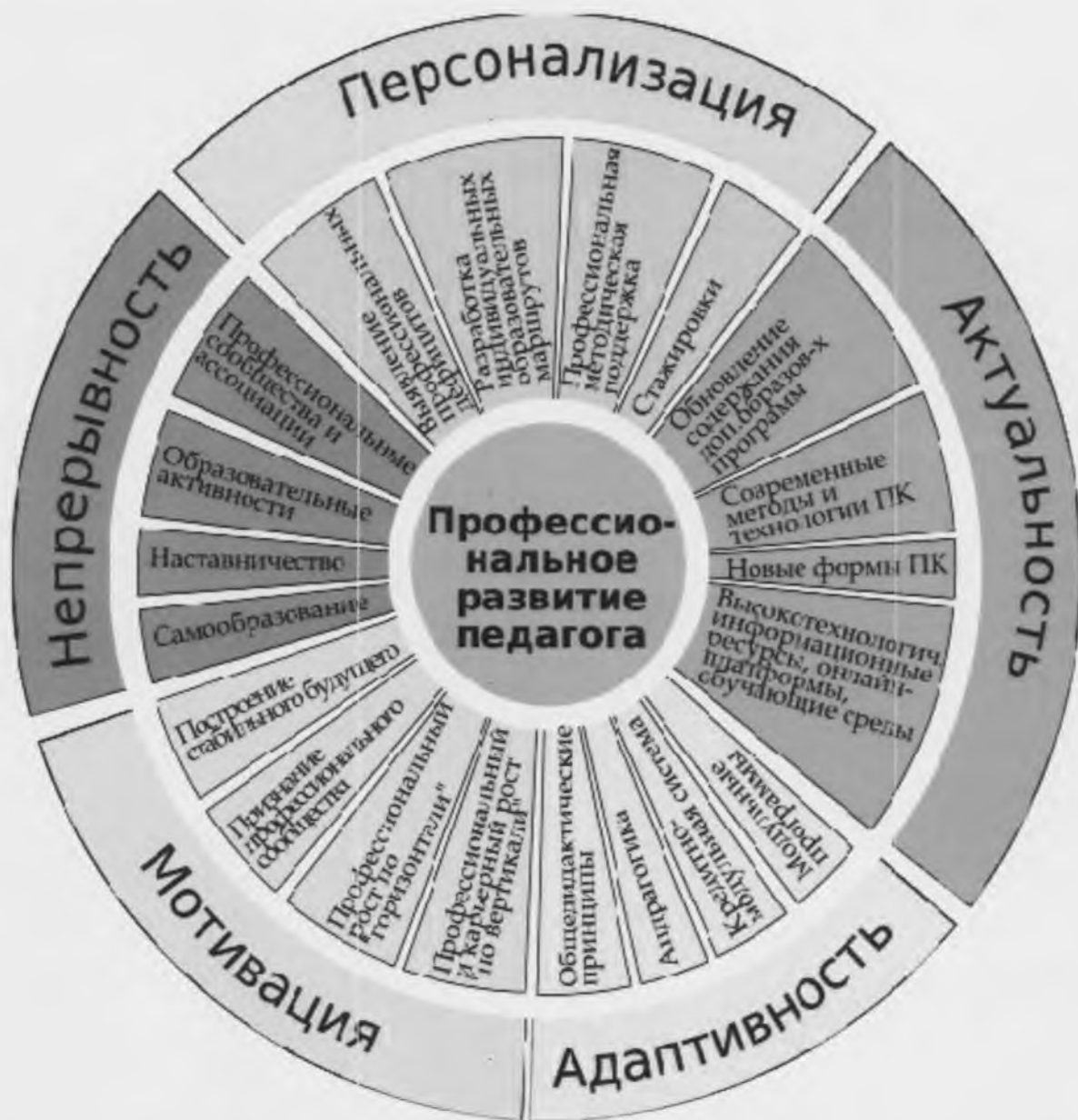
Рис. 1. Приоритеты дополнительного профессионального образования