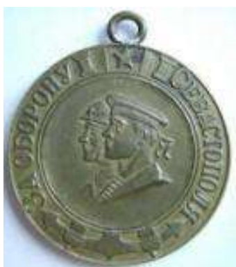
«За оборону Севастополя»