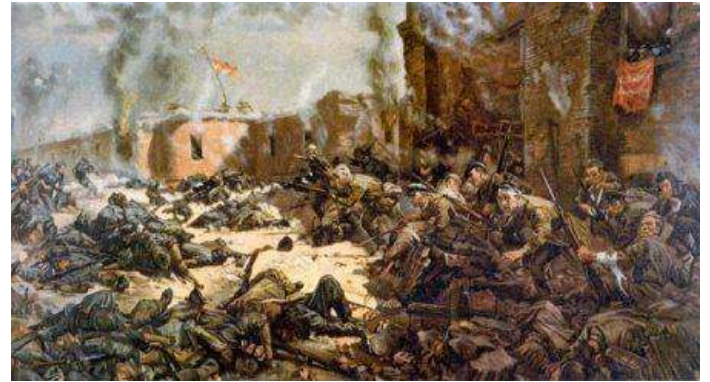
П.А.Кривоногов «Защитники Брестской крепости»