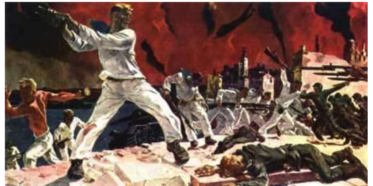
А.А.Дейнека «Оборона Севастополя»