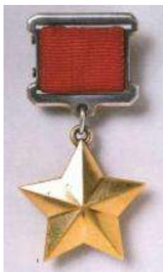
Медаль «Золотая звезда»

Назовите ордена и медали, представленные на фотографиях