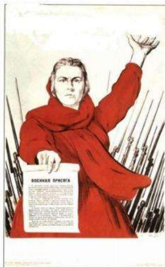
И.М.Тоидзе «Родина-мать зовет!»