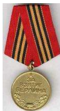
«За взятие Берлина»