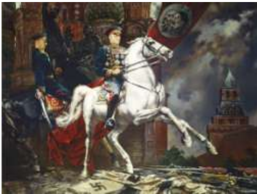
С.Н.Присекин «Парад Победы»