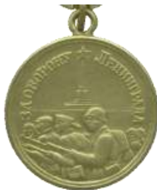
«За оборону Ленинграда»