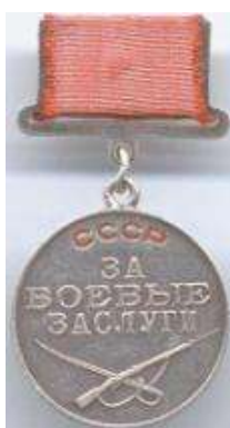
«За боевые заслуги»